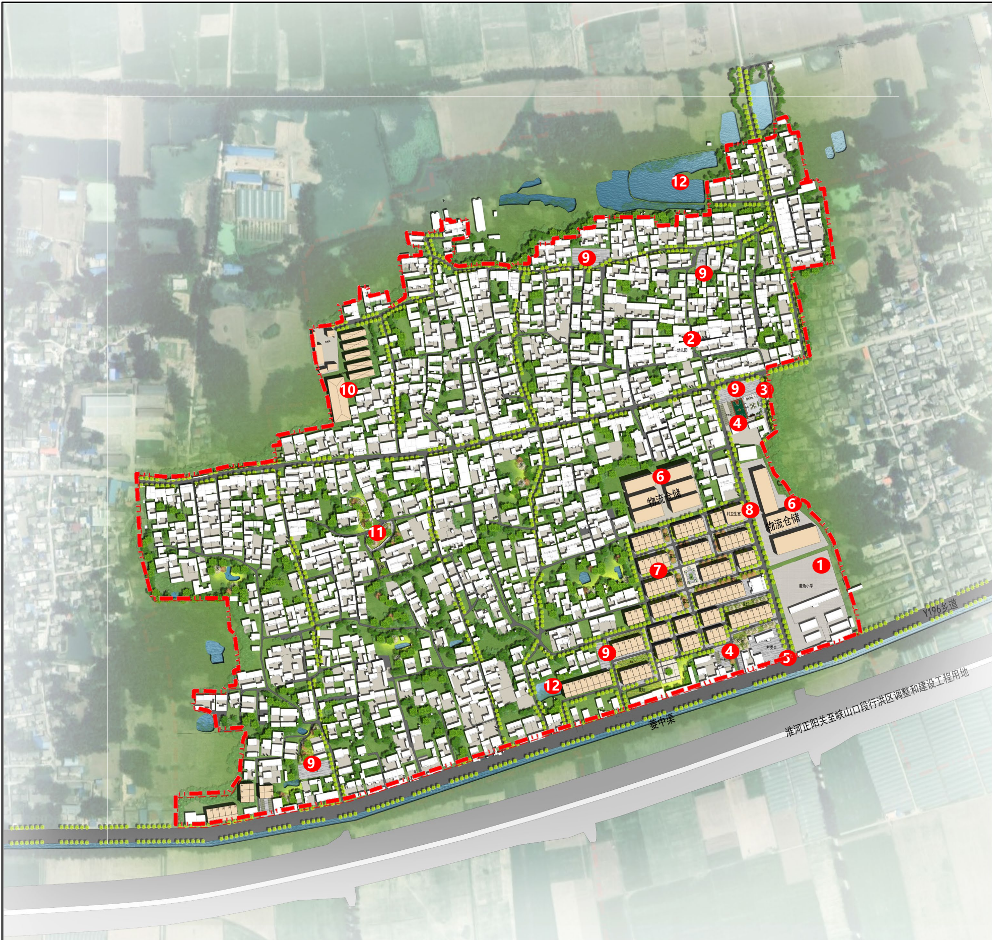
重点区域规划总平面图